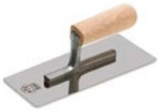
шпатель металлический (кельма)