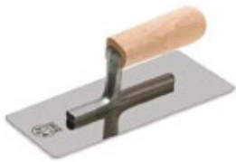
шпатель металлический (кельма)